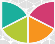
Таблица. Коммуникационная стратегия продвижения кафе