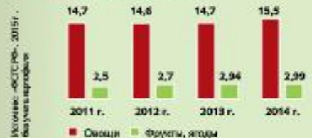
Структура валового сбора овощей в 2014г., %